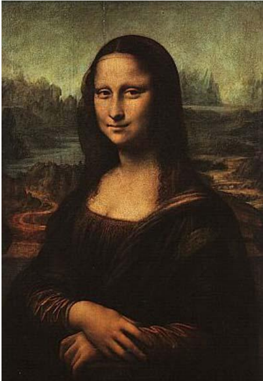
Η Μόνα Λίζα